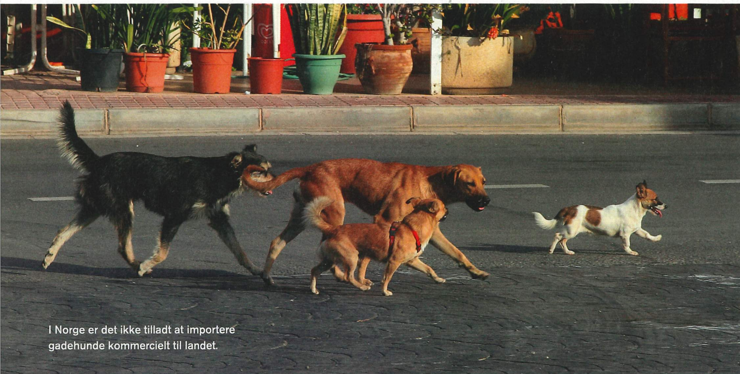
I Norge er det ikke tilladt at importere gadehunde kommercielt til landet.